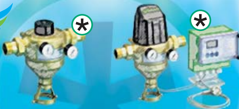
* МХ та МХА – промислові фільтри зі зворотним промиванням