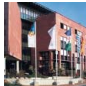
Штаб-квартира фирмы WIKA в городе Клингенберг, Германия