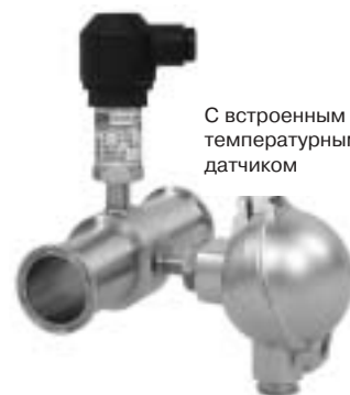
С встроенным температурным датчиком