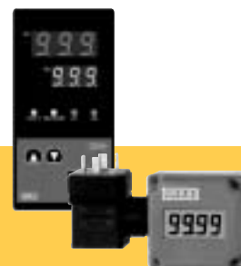
Индикаторы и терморегуляторы