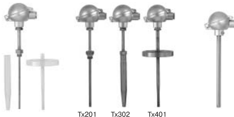
Tx201 Tx302 Tx401