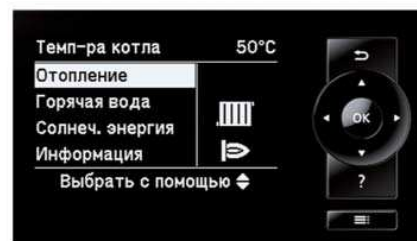
Новий регулятор Vitotronic

* В період роботи на максимальній потужності